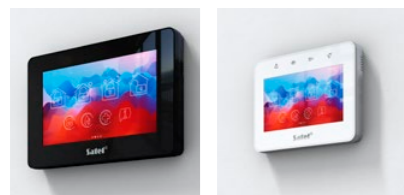
INT-TSI-B, INT-TSH2-B, INT-TSG2-W

Preferisci usare la tastiera per controllare il sistema? È un metodo facile da usare per ogni membro della famiglia, indipendentemente dall'età. La nostra gamma di prodotti comprende tastiere tradizionali (ad esempio INT-KWRL2 ) e l'esclusivo modello di tastiera touch INT-KSG2R , che combina soluzioni all'avanguardia con un design accattivante. Qual è la differenza tra quest'ultimo modello e gli altri? Il display grafico ampio e leggibile con i tasti touch sense offrono un comodo funzionamento in ogni circostanza. Un menù intuitivo facilita l'accesso alle funzioni più utilizzate e alle attività relative all'automazione domestica. Pertanto, anziché premere ripetutamente, è possibile toccare la tastiera una sola volta per avviare una sequenza di comandi preimpostati.